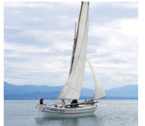
Quand la «Bonne Mère» met le cap sur le Vieux-Port... de Morges! Reymond

au logement d'une trentaine de navigateurs. «Je trouve ce grand lac magnifique. Je le connaissais déjà un peu de par nos reconnaissances préliminaires. Mais ce qui nous captive ici, c'est de pouvoir naviguer en eau douce! Nos bateaux sont faits pour la mer et il est intéressant d'apprécier leur comportement dans cet environnement particulier. Et puis, il y a la rencontre avec d'autres marins