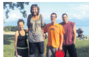
L'équipe dynamique a concocté des activités enrichissantes. Galaud

Vendredi soir, les grillades ont apporté le point final à cette aventure riche en découvertes. Un bar sans alcool ainsi qu'un espace pré-vention étaient de la partie. Cependant, la recette évoluera sans